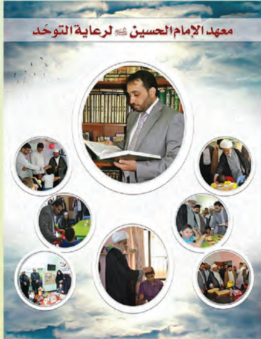
معهد الإمام الحسين \text{عليه السلام} لرعاية التوحد

كريلاء ولنجاح هذا المشروع تمّ العمل على توسيع نطاقه الى محافظات عراقية مختلفة اذا تسعى العتبة الحسينية المقدسة ومن خلال دار القرآن الكريم الى فتح فرع أخرفي محافظة البصرة